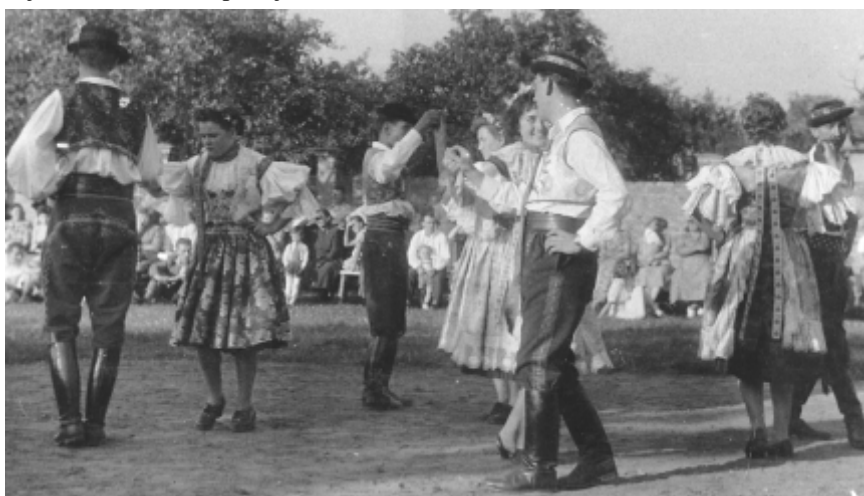
Obrázek 2 – Máje ve Vrbové Lhotě asi před 53 lety

Informace: Jitka Bernardová, Bc. Jana Boumová