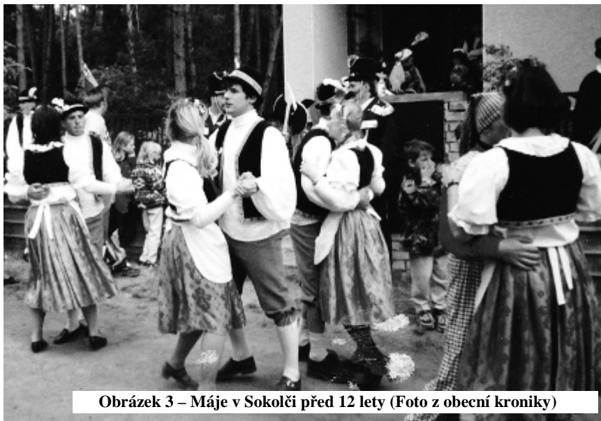
Obrázek 3 – Máje v Sokolči před 12 lety

Vydává OÚ Sokoleč. Za případné chyby se předem omlouváme.