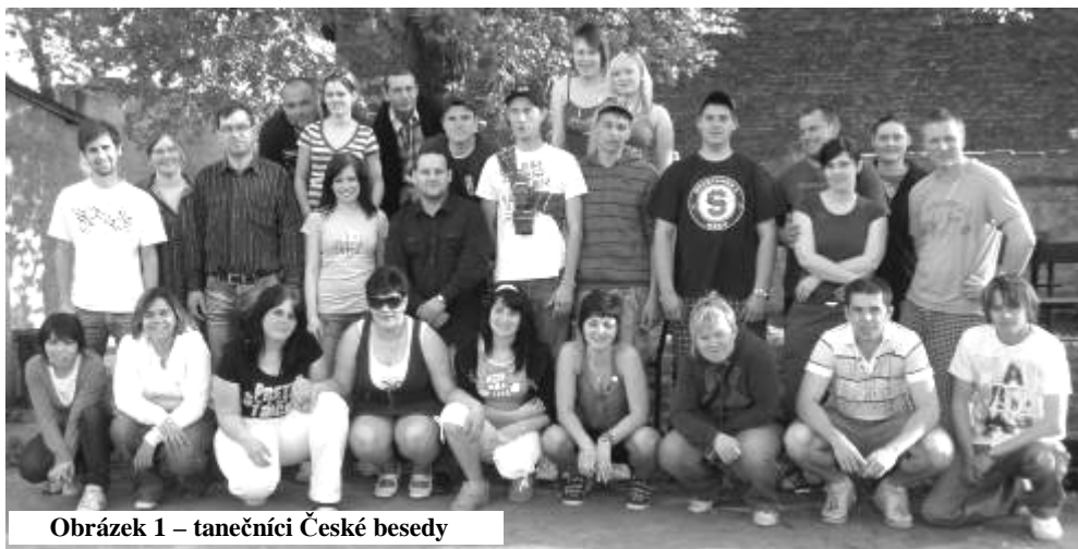
Obrázek 1 – tanečníci České besedy