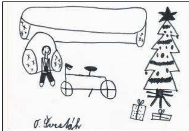
„Dárek po kterém nejvíc toužím.“