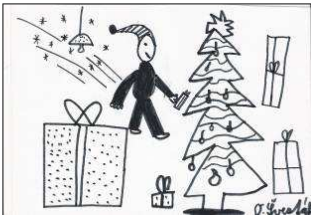
„Takhle u nás naděluje dárky.“