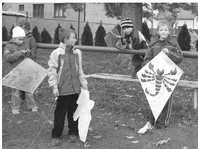
Při DRAKIÁDĚ, kterou uspořádala ZŠ na místním hřišti, představili žáci spoustu zajímavých modelů létajících draků.