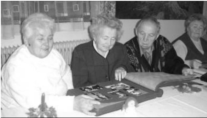
1. Při posezení byla možnost si prolistovat kroniky s fotodokumentací