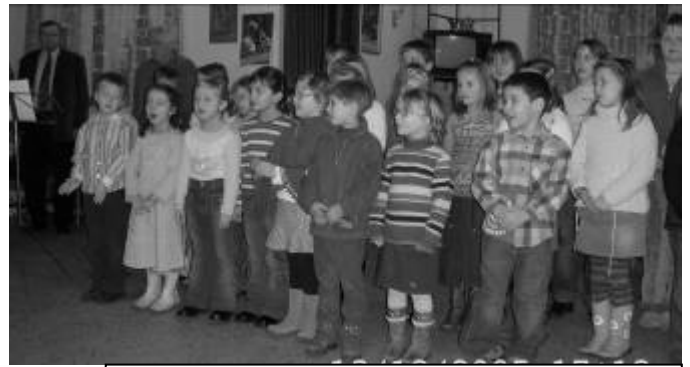
2. Vystoupení dětí ze ZŠ a MŠ všechny potěšilo.