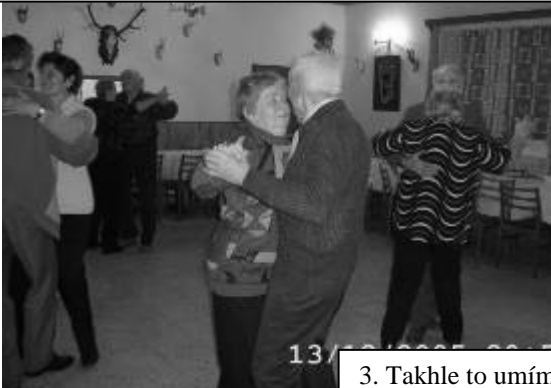
3. Takhle to umíme roztočit.