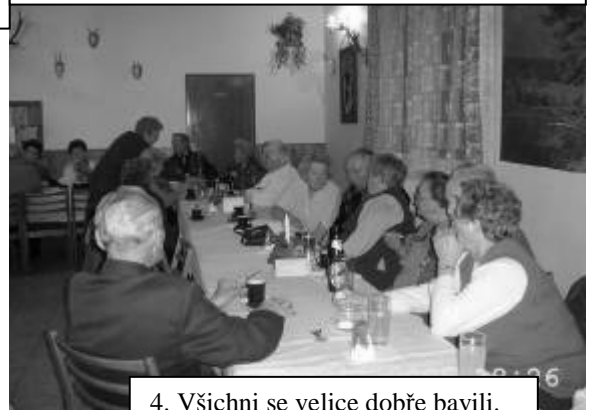
4. Všichni se velice dobře bavili.